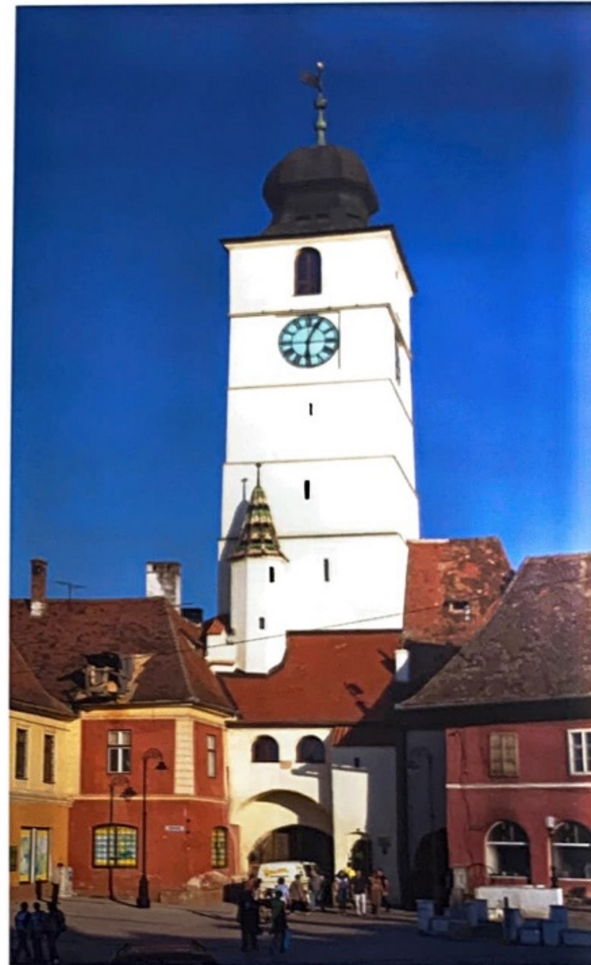
Turnul Sfatului Der Ratturm The Council Tower

În general, splendidele case din Piața Mare – caracterizate prin prezența unor elemente gotice, renașcentiste, neoclasiche, dar îndeosebi baroce – au aparținut nobililor ori unor personaje care au jucat un rol de seamă în viața