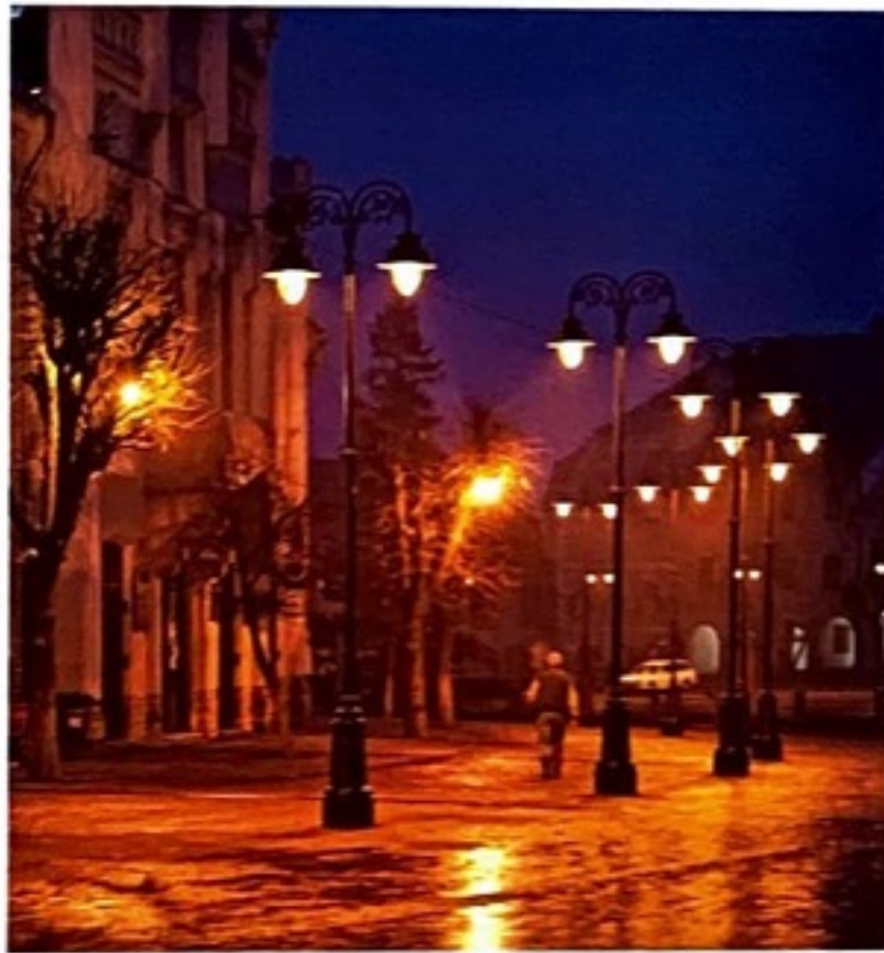
Felinare de fontă din Piața Mică Gusseiserne Laternen am Kleinen Ring Cast iron lamp posts, Small Square

Eine Reise durch Siebenbürgen (Transsilvanien) bedeutet gleichsam eine Reise durch die Kulturlandschaft der hiesigen sächsischen Ortschaften mit ihren Kirchenburgen, den kompakten Häuserreihen entlang der Dorfstraßen und den Dorfplätzen, wo sich einst das gesellschaftliche Leben der Gemeinschaften abspielte. Es wird kaum jemanden geben, der dabei nicht feststellen sollte, dass Siebenbürgen in jeder Hinsicht ein faszinierendes Gebiet voller Überraschungen ist.