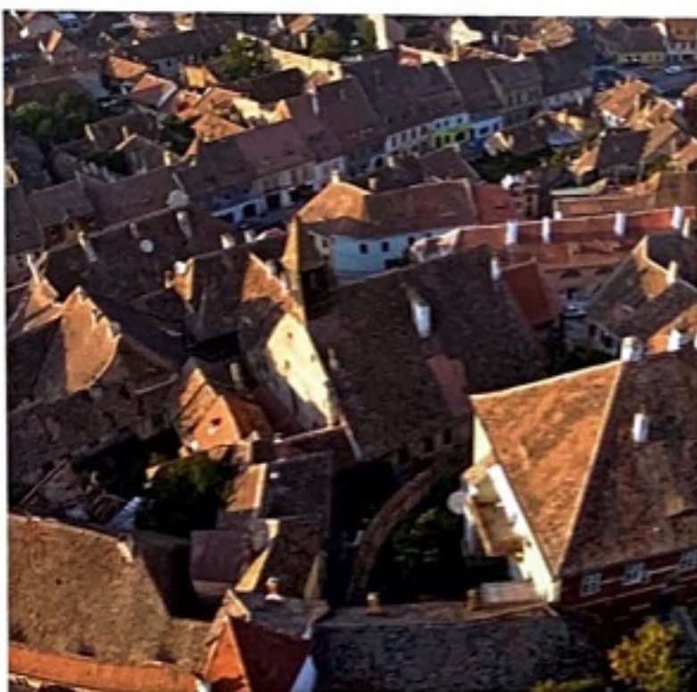
Orașul de Jos Die Unterstadt The Lower Town

O călătorie în Transilvania este sinonimă de bună seamă cu o incursiune în universul tipic al așezărilor săsești, compus din biserici fortificate, lungi șiruri paralele de case – adunate ca măgelele pe ață –, ale căror fațade privesc direct spre stradă, după model german, piețe care concentrau odinioară întreaga viață socială a comunității. Puțini sunt cei care să nu fie de acord cu următoarea afirmație: Transilvania este o regiune extrem de captivantă și surprinzătoare, din orice perspectivă am aborda-o.