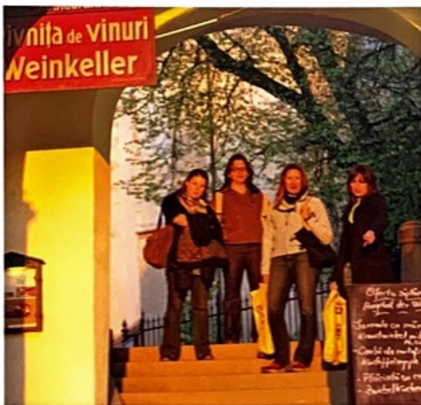
Popas la o crama din Pasajul Scărilor

Rast vor einem Weinkeller an der Pempflingerstiege